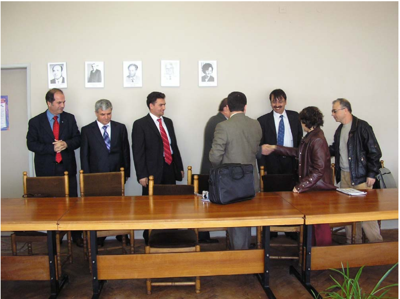
Посрещане на партньорите от Технически колеж - гр.Одрин