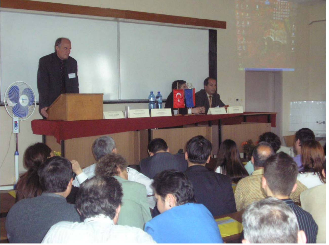
International Scientific Conference "Educational Policies of European Union" – 18 th May 2006, Yambol

20.05.2006 tarihinde boş zamanlarında konuklar Yambol'un grlecek ve gezilecek yerlerini ziyaret ettiler. Bunlar arasında Őehir Parkı, Kabile Ulusal Arkeoloji Rezervesi, Kabile "Sveta Bogoroditsa Manastırı", "Bakacık" Parkı, Jorj Papazov Sanat Galerisi ile konukların ilgisini çeken bazı zel Őirketler yer aldı.