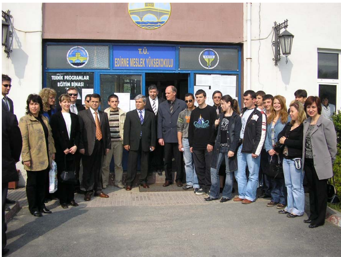
Българската работна група пред Техническият колеж в гр.Одрин

Следобедите в отделните дни и на 20.05.2006 год. през свободното си време гостите бяха запознати със забележителностите на град Ямбол: Градския парк, Археологическия музей в с.Кабиле, Манастира „Св.Богородица” край с.Кабиле, парка „Бакаджик”. Някой от тях посетиха Художествената галерия „Жорж Папазов” и фирми, към които проявиха личен интерес.